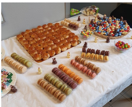
Les équipes bénévoles et salariés de l'association ADMR Pays Douessin

bonne chose de les réintroduire plus fréquemment au cours des mois à venir.