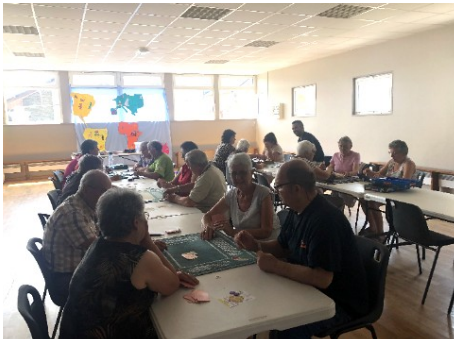
Moment de convivialité autour d'un jeu de carte - Association ADMR Rives du Thouet

"Chaque mois, nous allons dans une des 7 communes de notre secteur. Nous accueillons nos clients mais cette initiative est également ouverte à tous.