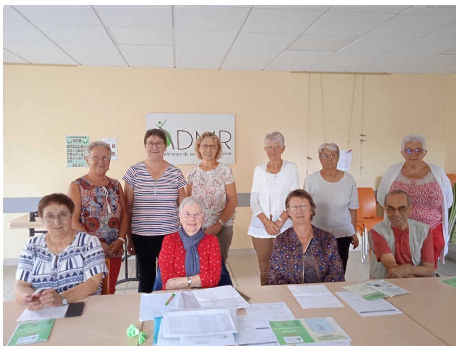
Une partie des membres de l'équipe de la commission "animation"

En Janvier, durant une demi-journée, des échanges fructueux entre les membres du bureau de l'association ADMR Coteaux de l'Evre et des membres de la fédération départementale ont permis d'avancer dans la compréhension des ambitions et des pratiques locales de l'association mais aussi dans la mise en place de projets sur Beaupréau-en-Mauges.